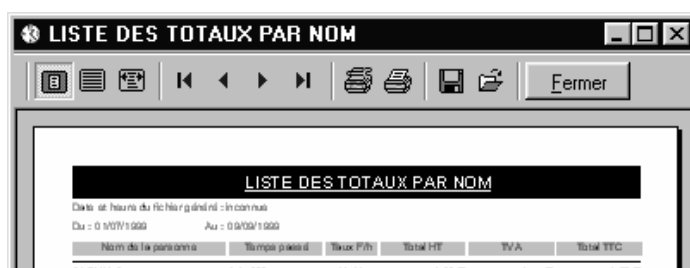
Figure 2 : Aperçu avant impression, « Liste des totaux par nom »