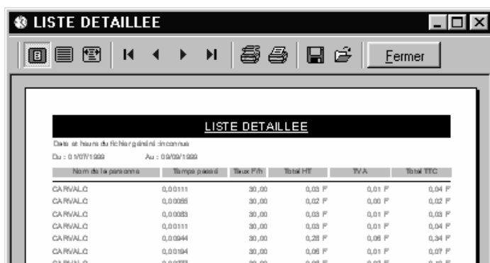
Figure 4 : Aperçu avant impression, « Liste détaillée »