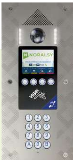
4G PRO V2 Finition Inox ou laiton

ACCÈS MOBILE EST COMPATIBLE AVEC NOTRE GAMME D'INTERPHONES 4G