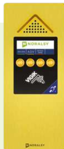
4G MINI Touch+ Finition Inox ou laiton