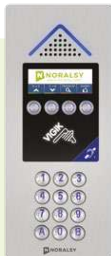
4G MINI + Finition Inox ou laiton