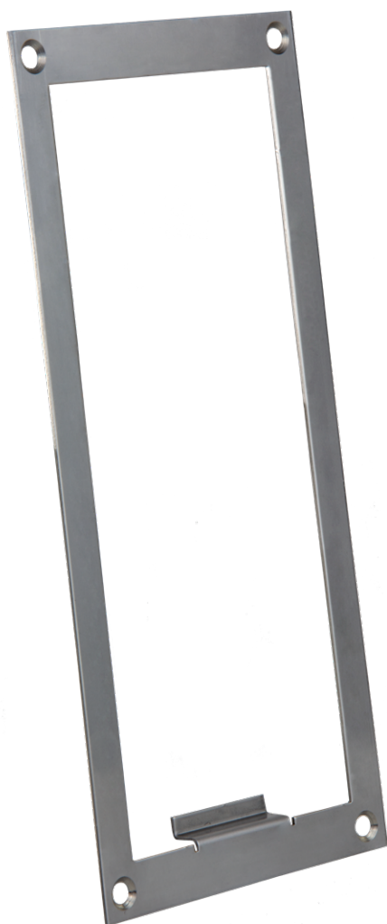
Modèle présenté : CP1